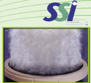
นั้วจ่าชอภาค Disc Diffuser