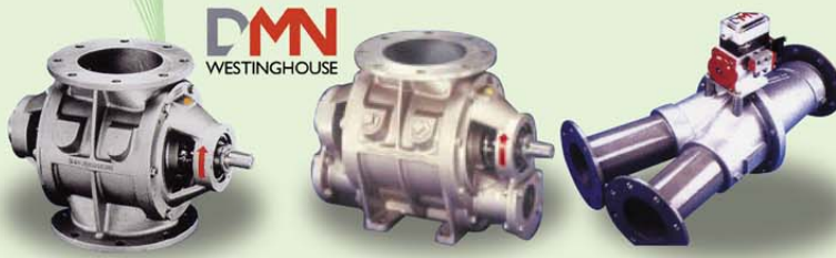
โรตารีวาล์ว Rotary Valve