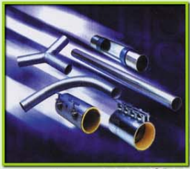
ท่, ข้องอ และคัปปลิง Pipe, Pipe Bend, Coupling