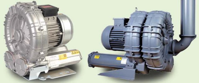
ริงโบลเวอร์ (Super High Pressure Ring Blower)