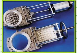
เกทวาล์ว Gate Valve