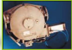
ไดเวิรเตอร์วาล์ว Diverter Valve