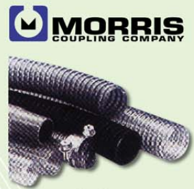
ท่อ่อน Flexible Hose