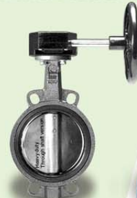
บัตเตอร์ฟลายวาล์ว Butterfly Valve