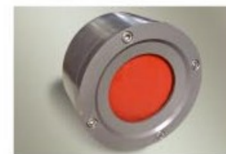
Swing Check valve