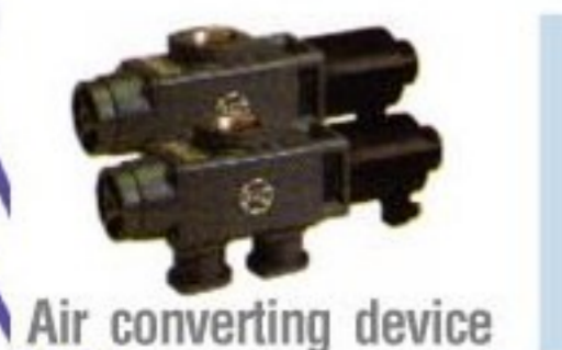
Air converting device