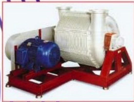
Multi-stage Centrifugal Blower