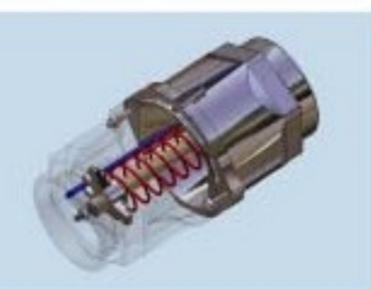
Pressure & Vacuum relief valve