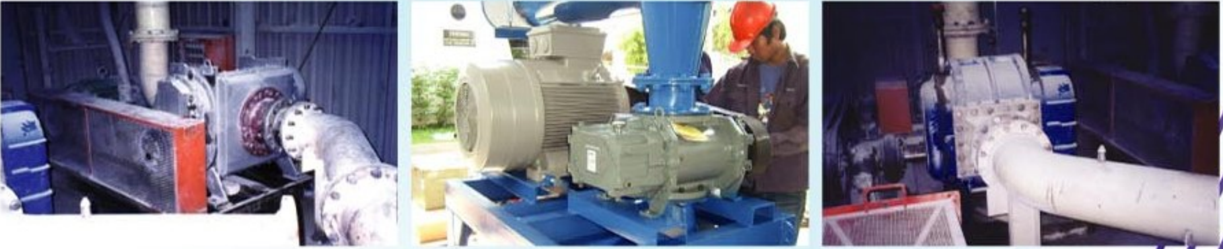
Pneumatics Conveying System