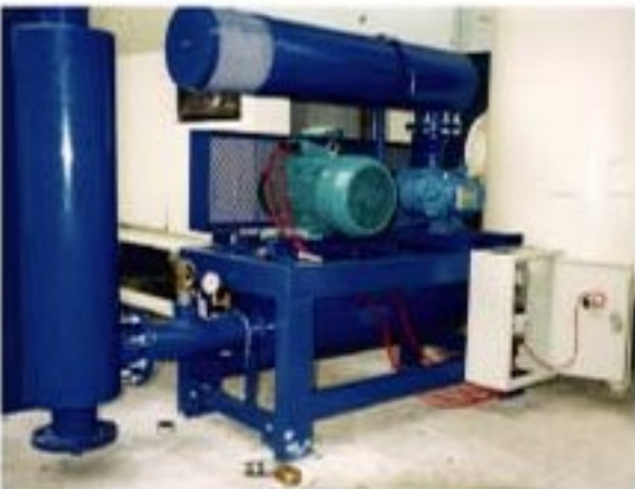
Back Wash Air Blower