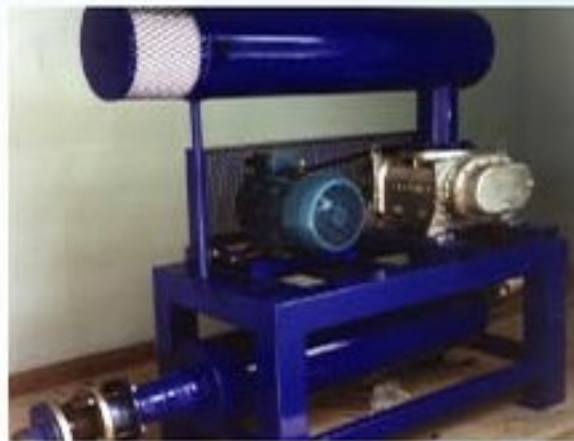
Waste Water Treatment System