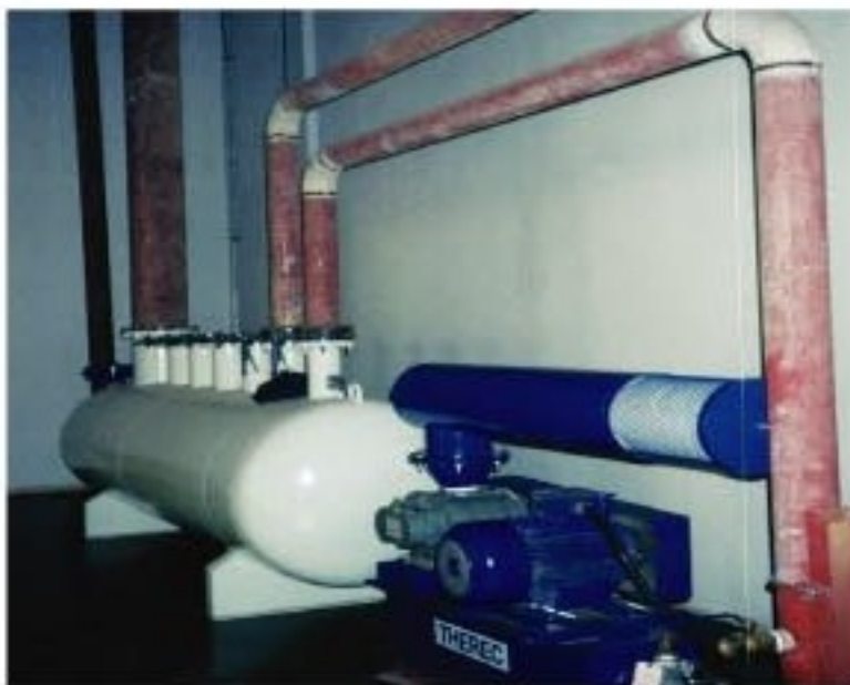
Central air supply system for gas burner