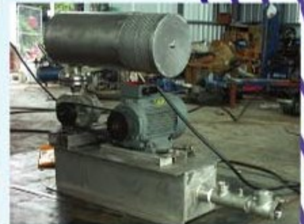
Soybean Sauce Mixings Tank