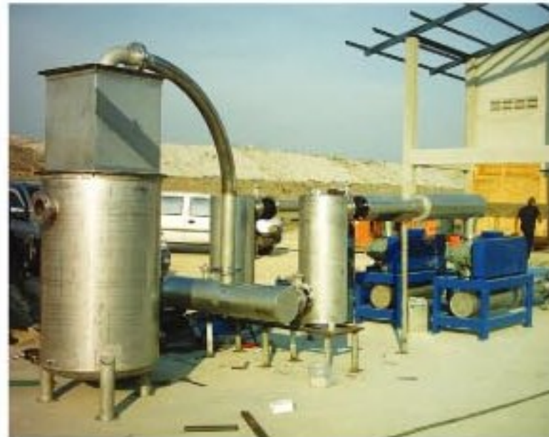
Water trap tank