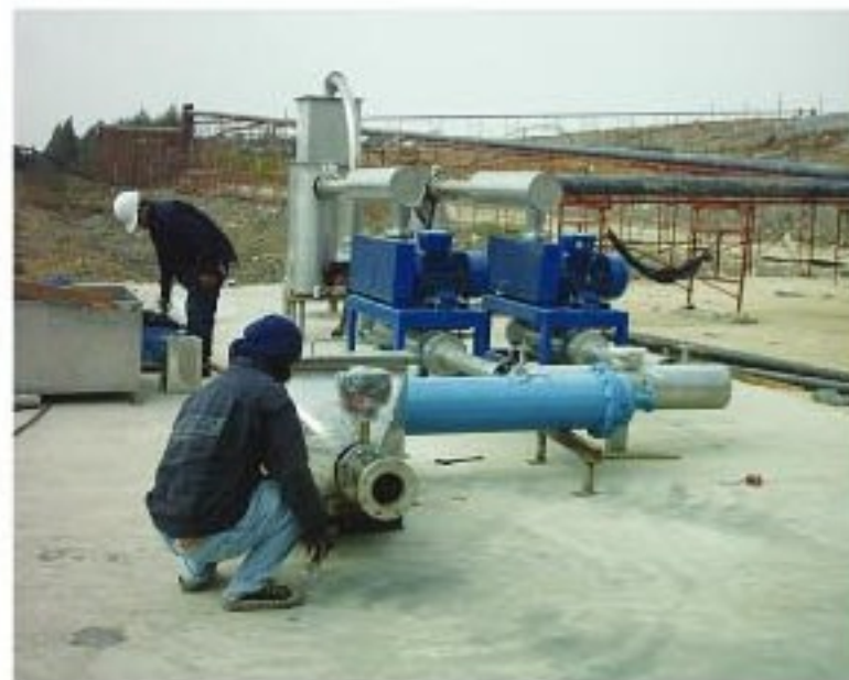
Roots gas blower