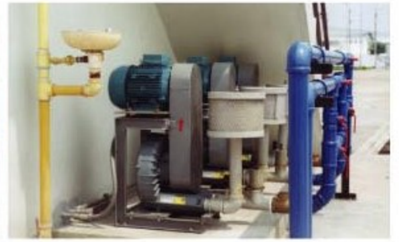
Waste water Treatment