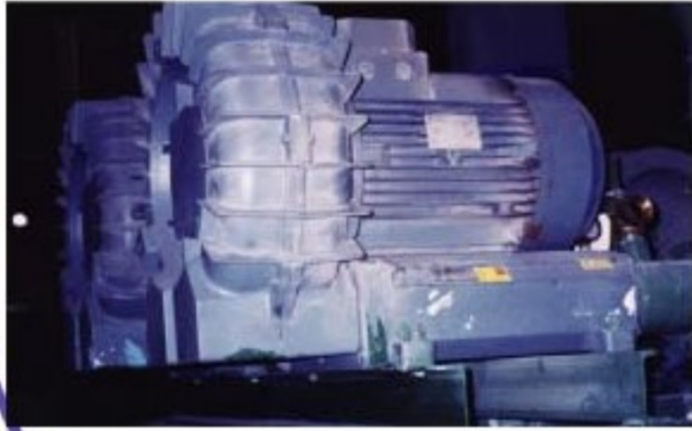
Painting Process (Air knife)