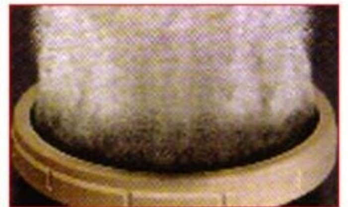
Fine Bubble Air Diffuser