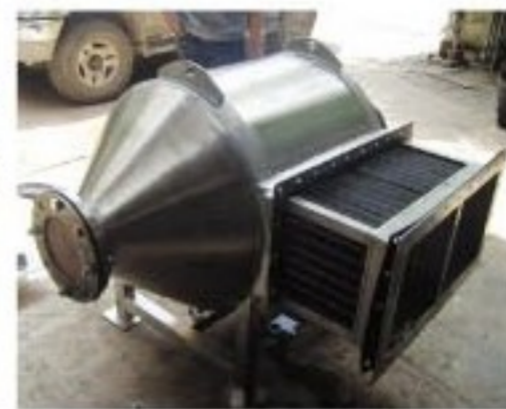
Air Cooling unit with out-let filter