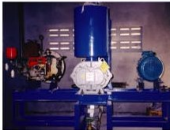
Aeration for Tiger Prawn Hatchery