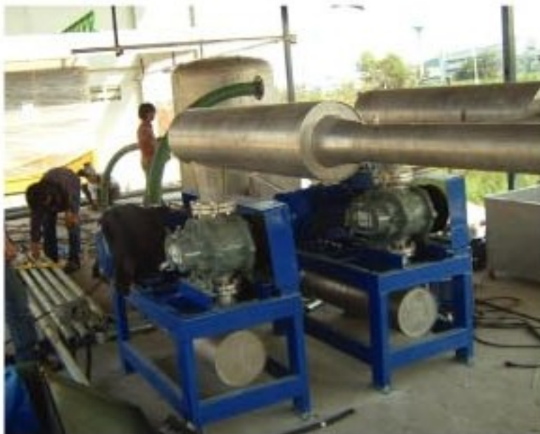
Installation on site