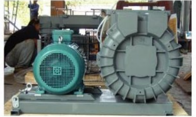
Central Vacuum Dust Collecting