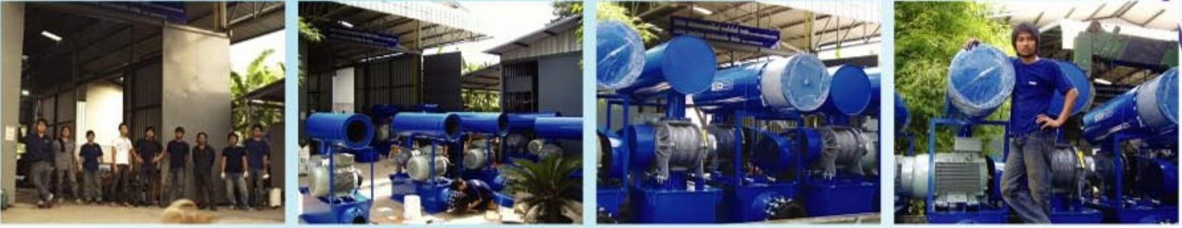
Our Fabricating Work Shop Facility