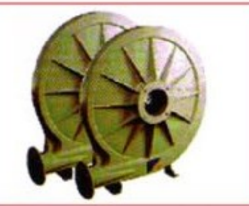
High Pressure Fan